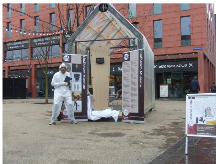
Fijne Feestdagen: "hoe wil je dood gevonden worden?"